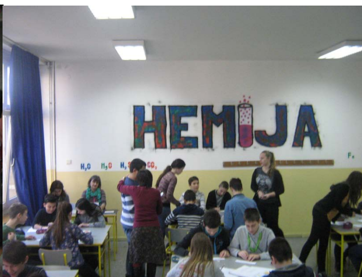
Љиљана Вуковић, наставник хемије